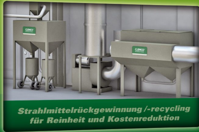
Strahlmittelrückgewinnung /-recycling für Reinheit und Kostenreduktion